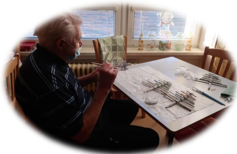
Rukodělná činnost – výroba dekorací