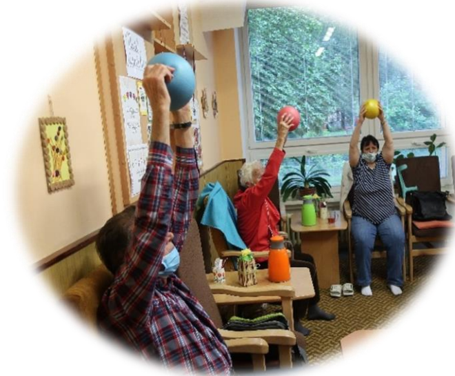
Uvolňovací a protahovací cvičení s míčem