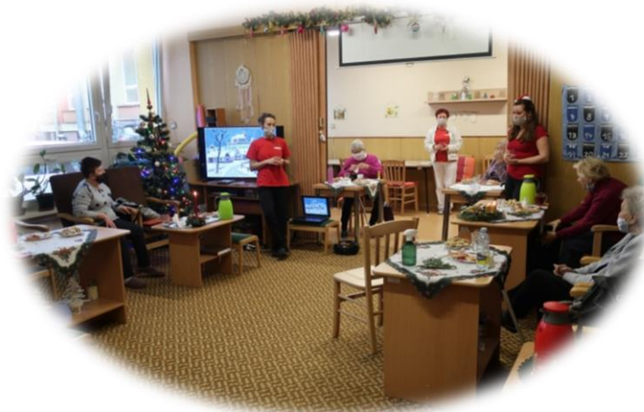
Společné vánoční posezení